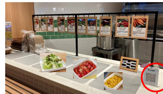
三井不動産「12階カフェスペース」内 サラダバーでサラダを購入したら &wellポイント付与