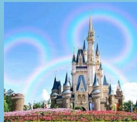
テーマパークチケット

&well Walkチーム対抗戦のユニークチーム名賞以外に、企業独自のユニークチーム名賞を設定。 選ばれたチームに賞品をプレゼント！