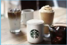
コーヒーチケット