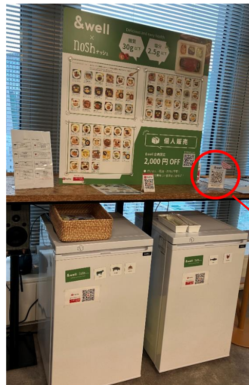
三井不動産「11階&well PIT」内 健康冷凍弁当「nosh」を購入したら &wellポイント付与