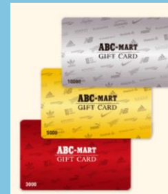
シューズストアのチケット